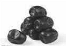
..... ( ب )

۱ - نام هر تصویر را از داخل متن پیدا کرده و زیر تصویر مربوط بنویسید. ( ۵/۰ ) أَلْقَلَاخُ يَسْكُنُ فِي بَيْتِ صَغِيرٍ . هُوَ يَزْرَعُ الْقَمْحَ وَ الْجَزَرَ وَالْمِشْمَشَ وَ التَّمْرَ فِي مَزْرَعَتِهِ .