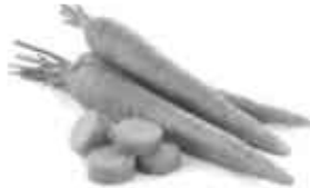
..... ( الف )

۲ - کلمه مناسب برای هر گروه را از داخل کمانک انتخاب نمایید . ( یک مورد اضافی است ) ( ۵/۰ ) ( دُخَان - حَدَاد - سَمَاء )